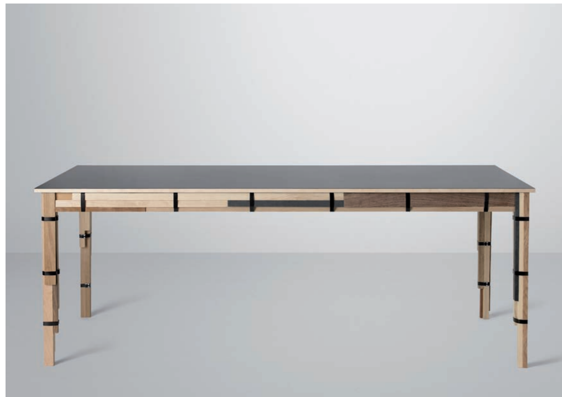
— Keep. Petter Thörne, Anders Johnsson / muuto. Mesa de comedor elaborada a partir de materiales sobrantes en la fabricación de mobiliario unidos por bandas de metal. Fabricada en diversos tipos de madera, tabla superior de linóleo y bandas de metal. Mide 200 centímetros de longitud, 90 centímetros de ancho y 75 de alto. — Dining table made from left-over materials in furniture manufacture, joined together with metal strips. Made from different types of wood, linoleum tabletop and metal strips. It measures 200 centimetres in length, 90 centimetres in width and 75 in height. www.muuto.com