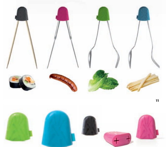
6 ■ Baggy Wine Coat. Jakob Wagner / Menu. Bolsa para mesa que sirve para ocultar las cajas de vino. Con capacidad para cajas de hasta tres litros y espacio para bolsas de hielo. Table bag that serves to conceal wine boxes. It can store boxes of up to three litres and has space for ice cube bags. 7 ■ Metropolis. Jaime Hayón / Lladró Atélier. Pieza de la colección de jarrones, lámparas, espejos y cajas diseñadas en forma de edificio que en conjunto sugieren una original metrópolis imaginaria y futurista. Piece from the collection of vases, lamps, mirrors and boxes designed in the shape of a building. Taken as a whole, they suggest an original imaginary futuristic metropolis. 8 ■ Easy Café. Hiromichi Konno / Stelton. Colección de vasos de cristal para té o café con asas ergonómicas en forma ovalada. Collection of glasses for tea or coffee with ergonomic handles in an oval shape. 9 ■ Milky Way Minor. Anna y Gian Franco Gasparini / Alessi. Set de cuchillos para diferentes tipos de quesos, en acero AISI 420. Set of knives for different types of cheeses, in AISI 420 steel. 10 ■ Hot-pot bbq. Black+Blum. Maceta y barbacoa en una sola pieza de acero inoxidable 430 y heat insulating ceramic coating. Planter and barbecue in a single 430 stainless steel piece plus heat-insulating ceramic coating. 11 ■ SL27 Link. Dreimann / Konstantin Slavinski. Mango de silicona versátil que permite combinar distintos tipos de cubiertos según la función que se le quiera dar. Versatile silicone handle that permits combining different types of cutlery depending on the function it are destined for.