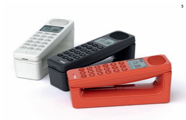
1 ■ Tea Strainer. Takuya Hoshiko, Frontnine / Kinto. Filtro portátil fabricado en silicona flexible y nylon. Largo regulable que se ajusta al tamaño de la taza. Portable filter made from flexible silicone and nylon. Adjustable length to fit the size of the cup. 2 ■ Wine & Bar. Aurélien Barbry / Normann Copenhagen. Colección para vino realizada en corcho y acero. Collection for wine made from cork and steel. 3 ■ LD. Jeremy & Adrian Wright / Lexon. Colección de elementos de escritorio en goma ABS. Collection of desktop elements in ABS rubber. 4 ■ Chikuno Cube. Chikuno Life. La superficie de este cubo de bambú vegetal presenta microscópicos agujeros que absorben cualquier líquido o gas, eliminando por completo sus olores, otorgándole la función de purificador de aire. The surface of this vegetal bamboo cube features microscopic holes that absorb any liquid or gas to completely eliminate odours, thus giving it the function of air purifier. 5 ■ DP 01. Jasper Morrison / Punkt. Inspirado en los teléfonos antiguos, permite ver la pantalla y marcar un número sin la necesidad de descolgar. Inspired in old-style telephones, it allows for a view of the screen and can dial a number without having to take the phone off the hook.