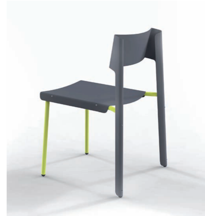
— Dakar. Marco Dessi / Skitsch. Silla ligera apilable de aluminio con respaldo constituido por una única pieza que se dobla hasta abrazar las patas. Permite su uso en exteriores y está disponible en cinco colores y en versión bicolor. — Lightweight stackable aluminium chair with a backrest made from a single piece that folds to embrace the legs. It can be used outdoors and is available in five colours and in a two-tone version. www.skitsch.it