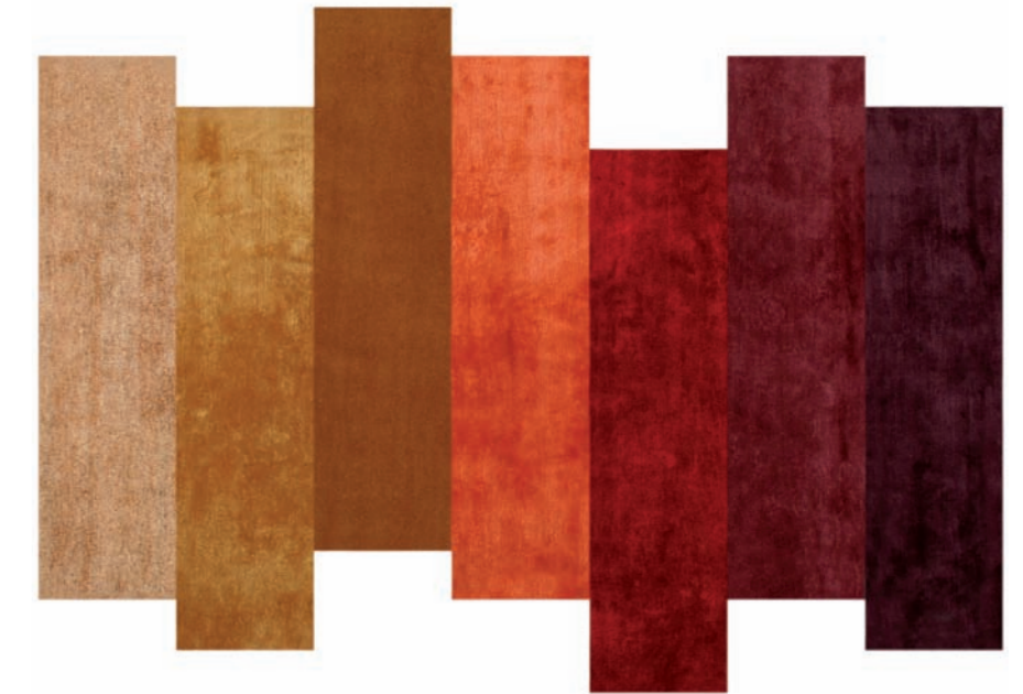
— Touch Experience. Jose Albers / Now Carpets. Siete fibras naturales: cañamo, bambú, lana, viscosa, seda, lino y banana se engarzan en una singular composición barrada, sin costuras de unión, que se adapta a cualquier superficie sin romper el juego geométrico original. La propuesta del diseñador incluye una combinación de siete tonos, desde ocres hasta berenjena, pero se puede personalizar. — Seven natural fibres: hemp, bamboo, wool, viscose, silk, linen and banana are set in a unique striped seam-free composition that adapts to any surface without breaking up the original geometric pattern. The designer's proposal includes a combination of seven tones, from ochres to aubergine, but it can be customised. www.nowcarpets.com