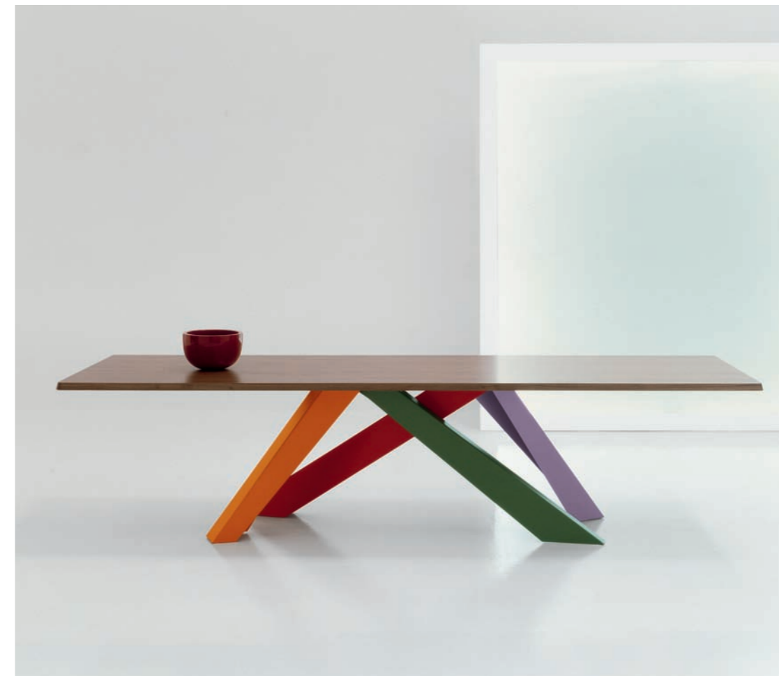
— Big table. Alain Gilles / Bonaldo. Creada en materiales tradicionales como el acero, la madera o el cristal, su original diseño permite una percepción distinta según el ángulo del que se mire. Las patas son placas de acero cortadas con láser de distintos anchos, diseñadas para 3 opciones de color: blanco, multicolor, o combinando marrones y grises. La medida del sobre rectangular puede ser fija y personalizable, o extensible. Se fabrica en cristal y nogal negro. — Manufactured in traditional materials like steel, wood and glass, its original design creates a different perception of the product depending on the angle from which it is viewed. The legs are laser-cut steel plates with different widths, designed for 3 color options: white, multicolor and combining browns and greys. The rectangular table top can be fixed as well as made to measure, or extendable. It is available in glass and black walnut. www.bonaldo.it