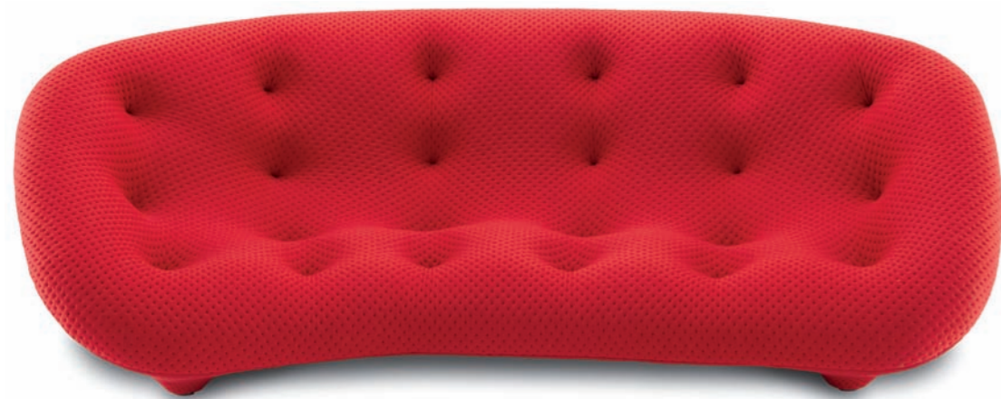
— Ploum. Ronan y Erwan Bouroullec / Ligne-Roset. Con forma de media luna tiende a aproximar a uno de sus cuatro ocupantes con los demás. Sillón relativamente bajo en el cual se utiliza de forma conjunta una tela elástica y espuma ultraflexible para que cumpla dos requisitos esenciales, que sea de uso flexible y cómodo. — Shaped like a half-moon, it tends to bring one of its four occupants closer to the others. Relatively low armchair that jointly uses an elastic fabric and ultra-flexible foam to comply with all essential requirements such as flexible and comfortable use. www.ligne-rosset-usa.com