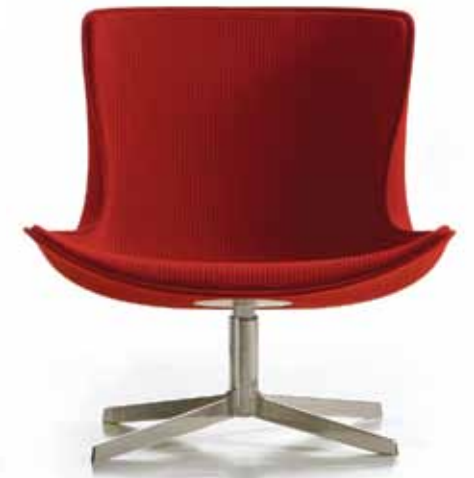
VIKA Monica Förster Bernhardt Design