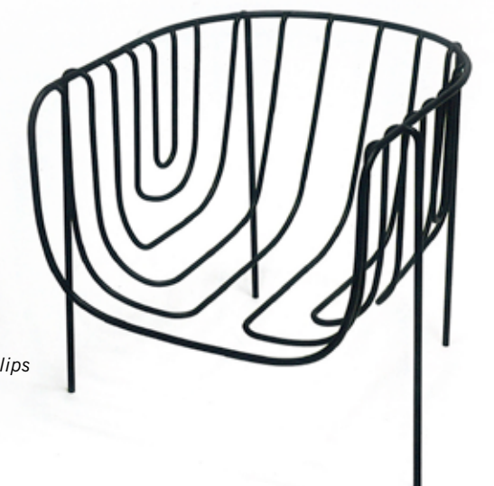
NOM ????? Studio Nendo, installation « Thin Black Lines », Phillips de Pury /Saatchi Gallery ? éditeur ????