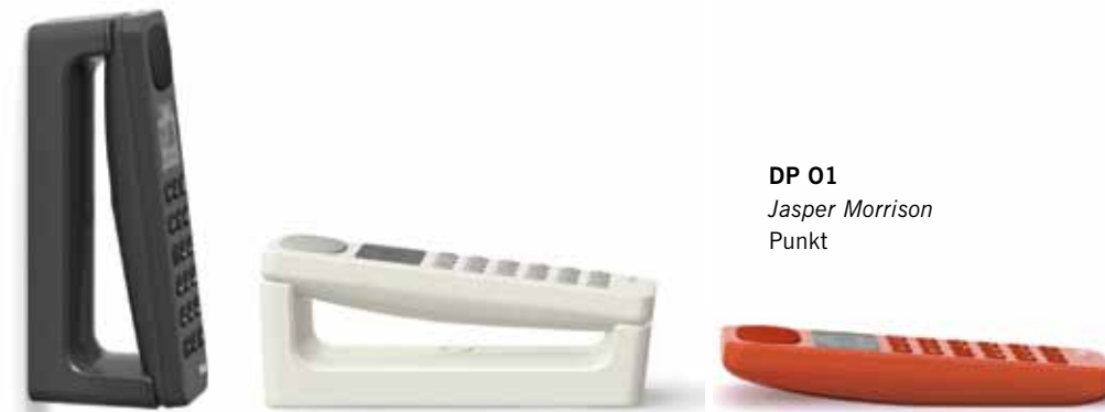
DP 01 Jasper Morrison Punkt